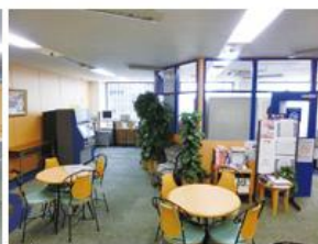
ラウンジ (約144平方メートル) ・テーブル個数: 4個 ・椅子個数: 20脚 ・50インチ液晶テレビ ・DVDプレイヤー